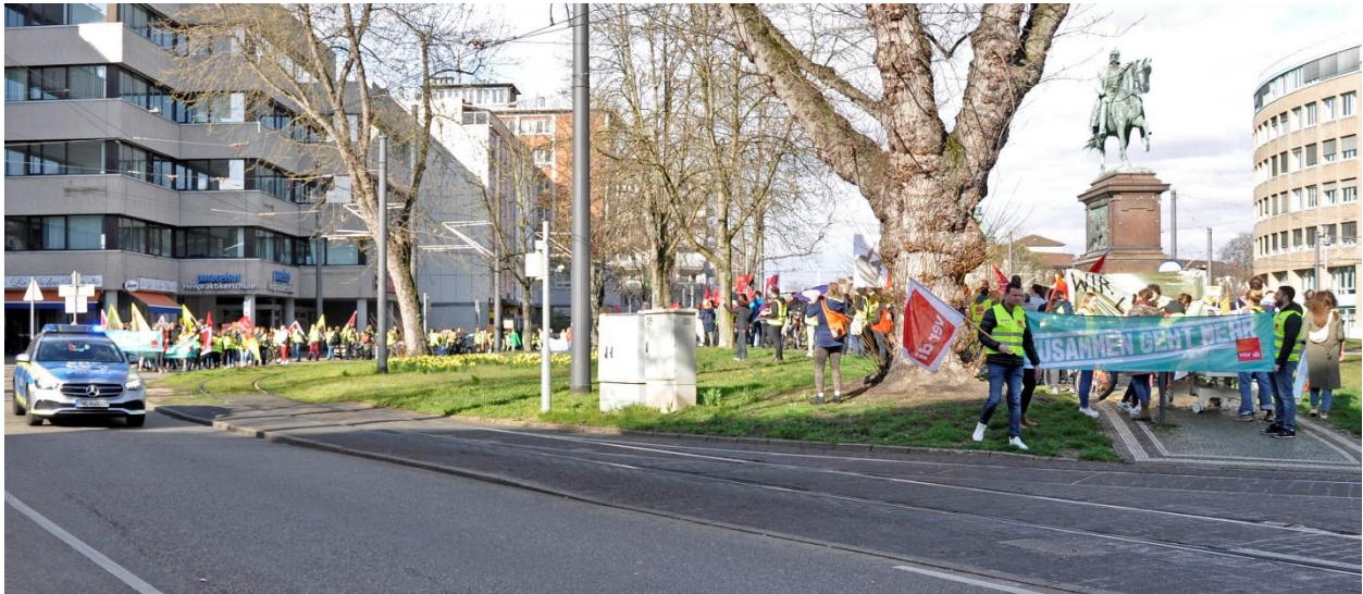
Eindrucksvoll wie sich die beiden Demonstrationzüge am 16.3. vereinigen

Die Beschäftigten der beiden großen Krankenhäuser in Karlsruhe haben in dieser Tarifrunde gezeigt, dass sie sich mit der Misere in ihren Kliniken nicht mehr abzufinden bereit sind. Zum ersten Mal und dann gleich in großer Zahl haben die Kolleg*innen der Vidia-Kliniken an Streiks und Demonstrationen teilgenommen. So haben sie gemeinsam mit dem SKK am Warnstreiktag 15.03. mit über 700 und am Warnstreiktag vom 22.03. mit ca. 1.500 Kolleg*innen durch die Kaiserstraße demonstriert und schließlich mit anderen Beschäftigten des öffentlichen Dienstes zu 3.000 den Marktplatz gefüllt.