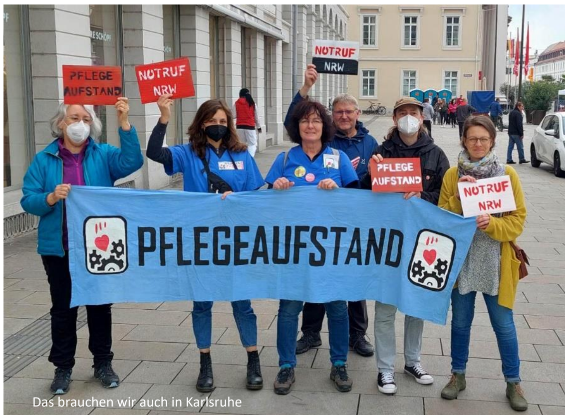
Das brauchen wir auch in Karlsruhe

Bleibt zu sagen: Berufsanfänger oder Berufsaussteiger oder -rückkehrer gehen dorthin, wo es bessere Arbeitszeiten, wo es verlässliche Dienstzeiten und Urlaubsplanung gibt.